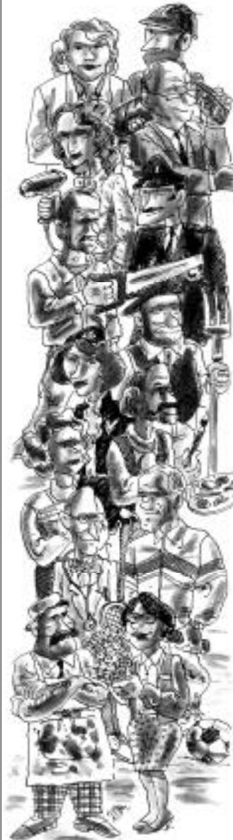
VOUS ET LES VÔTRES

27 L'un d'eux a-t-il eu une période de chômage de plus d'un an dans les 5 dernières années ?